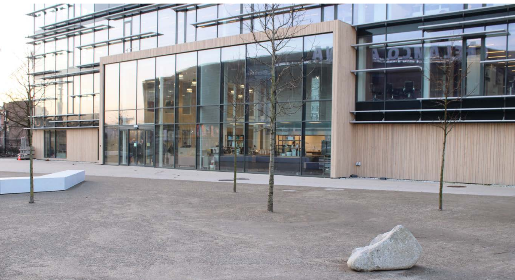
KoMex EWD rond boomspiegels in combinatie met KoMex BIO Naturel.

Deze Koersmix halfverhardingen zijn zeer stabiel en onderhoudsarm, hebben een natuurlijke uitstraling, een zelfherstellend vermogen en hebben een uitstekende water- en luchtdoorlatende functie. Gemeenten, aannemers, waterschappen en overige instellingen zoals Staatsbosbeheer, Na-